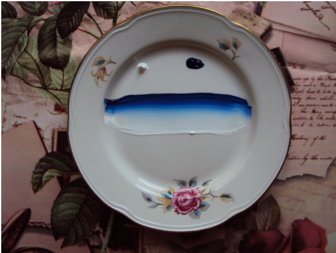
9. Двойным мазком прописываем цветы.