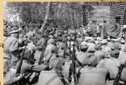
Театральные актеры на фронте во время Великой Отечественной войны 01.08.1942

С первых дней войны Пленум ЦК профсоюза работников искусства обратился к деятелям искусства с призывом принять участие в великой освободительной борьбе. Президиум Всероссийского театрального общества (ВТО) 3 июля 1941 г. принял решение начать работу по созданию оборонного и антифашистского репертуара. Для обслуживания армии и флота было сформировано около 400 театрально-концертных и цирковых бригад, создано 25 фронтовых театров. Всего за годы войны на фронт выезжало 42 тыс. артистов, которые дали 1350 тыс. представлений, в том числе 437 тыс. непосредственно на передовой. Основными темами в репертуаре театров и бригад являлись единство и сплоченность народа перед лицом врага, героизм воинов, патриотизм, раскрытие характеров советского человека, отечественная история и др.