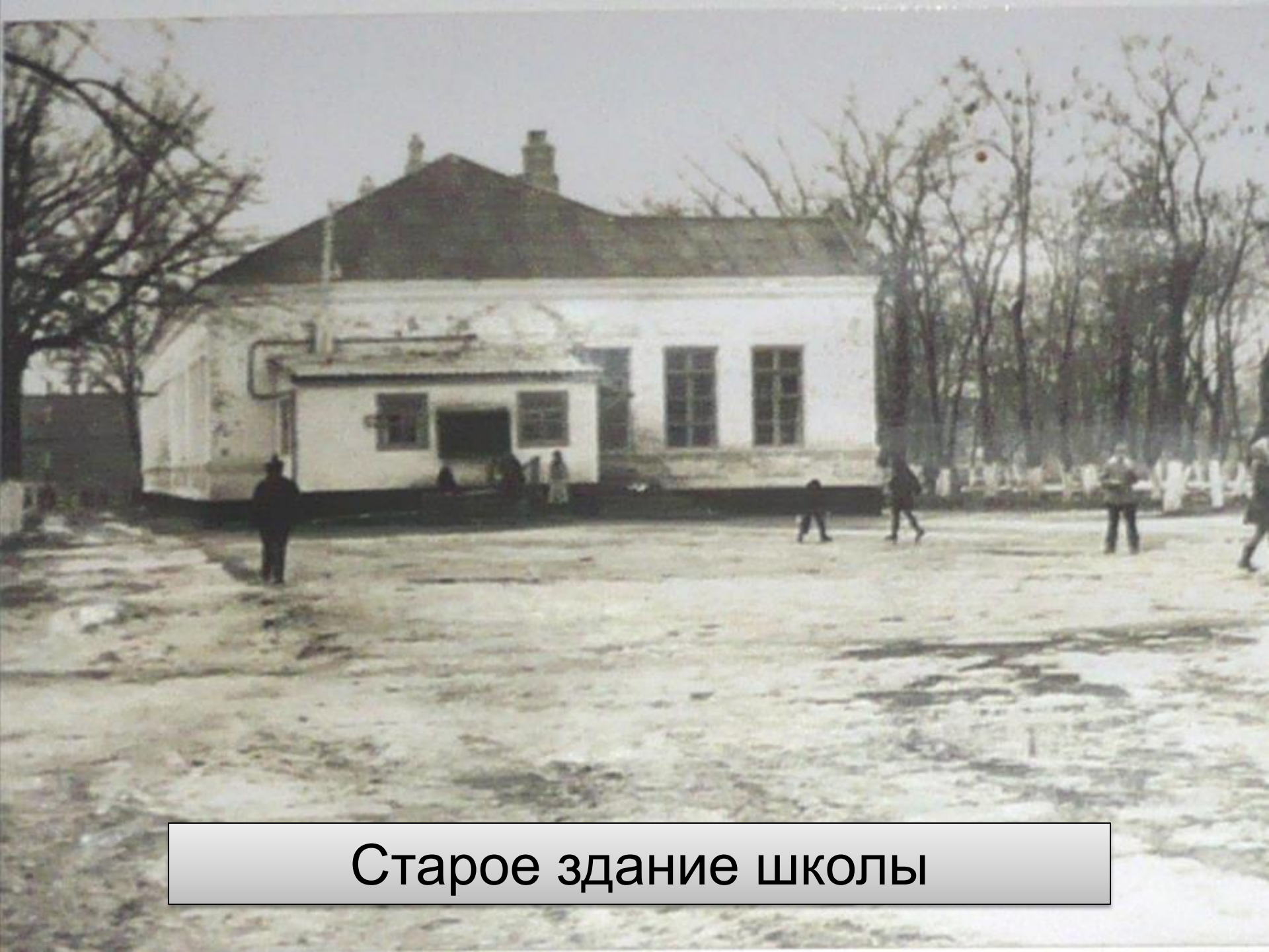
Старое здание школы